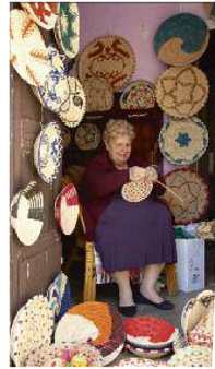
In Castelsardo vlucht een vrouw kleurige mandjes.