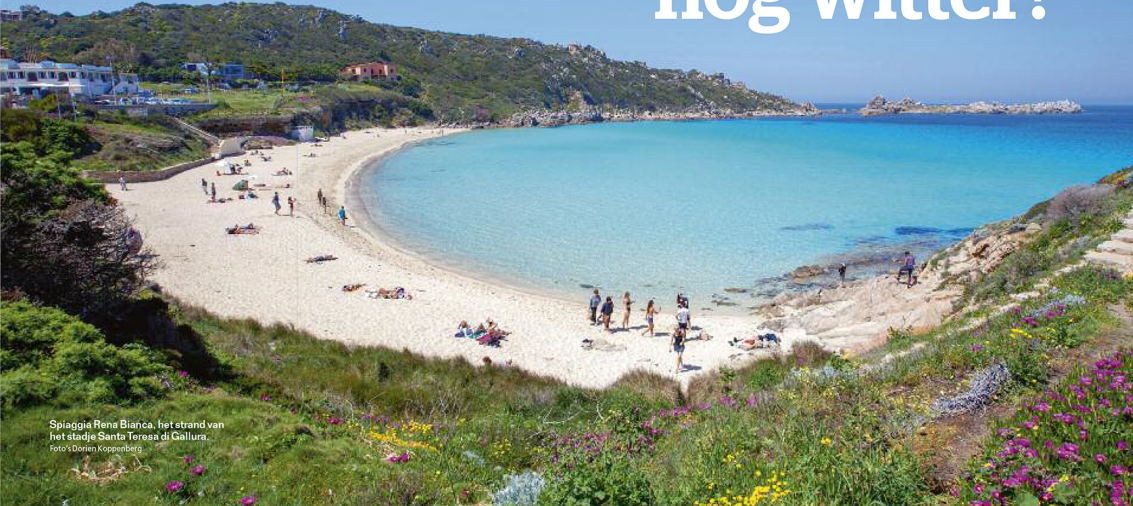
Spiaggia Rena Bianca. Het strand van het stadje Santa Teresa di Gallura.

Tijdens een autotoerje door het noordwesten van het eiland ontdekken we dat het zonde is om Sardinie alleen te bezoeken voor strand en natuur. Langs de groene kustweg valt ons oog al snel op Castelsardo, een middeleeuws kasteel dat machtig uittorent boven een oud stadje met kronkelstratjes en steile trappen. En met vrouwen die in hun deuropening de kleurige mandjes vliechten waarmee Castelsardo aan de weg timmert. Een stukje landinwaarts kijken we onze ogen uit in de Vallei van de Nuraghi, waar het gelijknamige volk 3.500 jaar terug kegelvormige torens bouwde van los gestapelde zwerfkeien. Je ziet ze overal in het Sardijnse landschap, maar vlakbij Torralba kun je ze van binnen bekijken. De toren Santu Antine bestaat uit een doolhof van trappen, taps toelopende gangen en kamers, feestiek verlicht via spleten in de muur. Dan rijden we het smalle schiereiland op naar het vissersdorp Stintino. Het wordt steeds stiller op de weg en we passeren zoutpannen tegen een verblindend wit schelpenstrand. Maar het hoogtepunt wacht ons op het uiterste puntje: Spiaggia della Pelosa. Het poederige zand lijkt er nog wit-