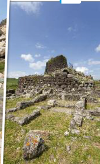
Het Nuraghi-volk bouwde 3.500 jaar geleden torens van opengestapelde zwerfkeien.