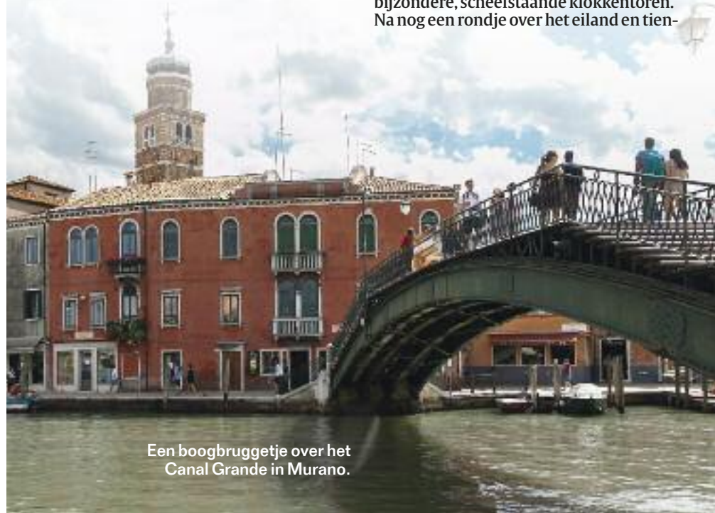
Een boogbruggetje over het Canal Grande in Murano.