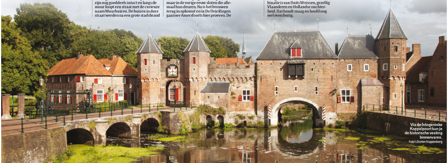
Via de fotogenieke Koppelpoort kun je de historische vesting binnenvaren.

«Vroeger deelden we ook shag uit», vertelt gastheer Gert, «maar nu alleen eijtes, die we een zestal minuten koken.» We tikken er graag een beetje weg, al voorzieit huisbrouwer Gor ons ook ruim van kaas en worst bij het proeven van de huisbieren. Van het warmbloedige Vuurvogel tot het naar de brouwer genoemde CorDeux, dat een combinatie is van Duits Weissen, gezellig Vlaanderen en Hollandse nuchterheid. Dat houdt maag en hoofd nog wel even bezig.