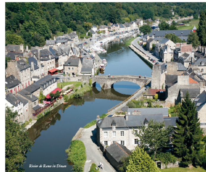
Rivier de Rance in Dinan

Langs het water zakken we af richting de zee en maken een stop in Dinan. Het kanaal is inmiddels de rivier de Rance geworden en het is indrukwekkend om te zien hoe deze rivier de rotsen in de loop