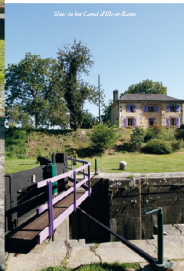
Sluis in het Canal d'Ille-et-Rance