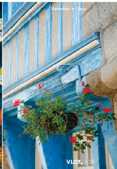
Vakwerkhuis in Dinan