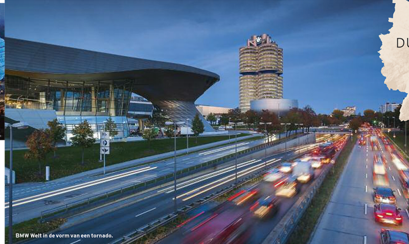
BMW Welt in de vorm van een tornado.