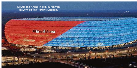
De Allianz Arena in de kleuren van Bayern en TSV 1860 München.