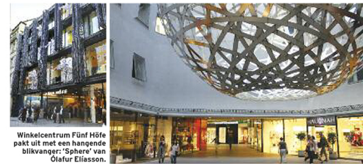
Winkelcentrum Fünf Höfe pakt uit met een hangende balkvanger: 'Sphere' van Olafur Eliasson.

heeft zijn lichtspel. Een functioneel spel, want het voetbalstadion is de thuisbasis van zowel Bayern München als het in de tweede Bundesliga spelende TSV 1860. Speelt Bayern, dan kleuren de kunststof lichtkussens van dak en wanden rood. Voor TSV 1860 is dat blauw. En licht het stadion wit op, dan speelt het nationale elftal er een wedstrijd. Tijdens de toeristische tour mogen we, alsof we zelf het veld op moeten, het stadion via de spelerstrasse betreden, onder de opzweepende klanken van 'Pirates of the Caribbean'. Er zit vandaag niemand op de tribunes, maar de impact is er niet minder om. Spelers moeten stalen zenuwen hebben! In de kleedkamers zien we hoe ze zich terug kunnen ontspannen, op massagetafels en in warme baden. Boven elk kastje hangt een foto van de speler die er zijn spullen opbergt. De dagen van Jean-Marie Pfaff en Daniel van Buyten liggen helaas achter ons, alleen Arjen Robben houdt de eer der Nederlandsspelerende hier nog hoog. In het hippe restaurant Der Gesellschaftsraum ontdekken we dat ook de Duitse keuken in München tot moderne hoogten reikt. Geen schnitzeltjes die over de randen van je bord vallen, maar verfijnde en fraai ogende vlees-, vis- en vegetarische gerechten die met elk bijgerecht een smaakexplosie teweegbrengen. Ze worden bereid en geserveerd door ruige jongens en meiden met sleeve tattoos, die bij elke gank de wijnkeuze toelichten.